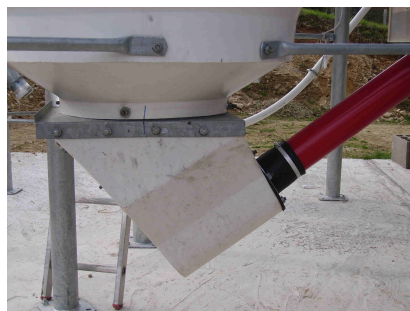
Reprise par vis